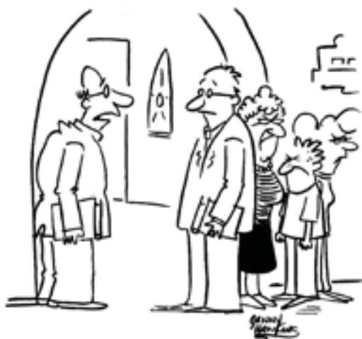
Marko, čini se da su svi tvoji obiteljski problemi iza tebe.