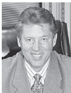
John C. Maxwell

Als Folge von Moses verändertem Leiterschaftsstil wurde er stärker, und das Volk wurde friedlich. Wenn Sie eine Kerngruppe von Leitern entwickelt haben, die sich in andere investiert, wird ein Zyklus beginnen und Ihre Dienstmöglichkeiten werden sich vergrössern. Es mag fantastisch tönen, aber wenn es für Mose und die Millionen widerspenstiger Menschen, die er durch die Wüste führte, funktionierte, kann es auch für Ihren Dienst funktionieren.