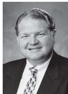
Байрон Клаус, Президент Теологічної семінарії Асамблей Божих, м. Спрінгфілд, штат Міссурі