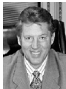
John C. Maxwell

Le changement d'approche dans la façon dont Moïse dirigeait lui permit d'être plus fort, et permit au peuple de vivre davantage dans la paix. De même, lorsque vous aurez développé un noyau de base constitué de dirigeants qui commencent à s'investir dans la vie des autres, un cycle commence et vos opportunités dans le ministère iront en grandissant. Cela peut paraître énorme, mais si cela a fonctionné pour Moïse et les millions de gens récalcitrants qu'il a conduit à travers le désert, cela peut bien fonctionner pour vous aussi.